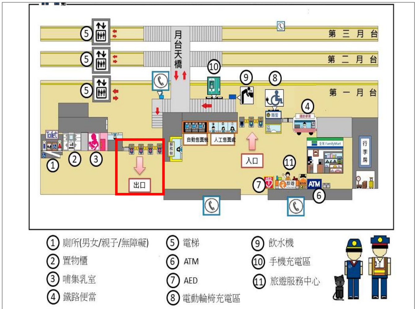
彰化台鐵接駁地點示意圖